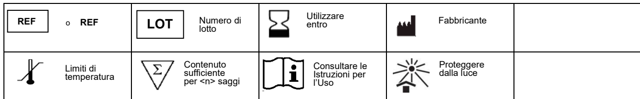
TABELLA DEI SIMBOLI APPLICABILI