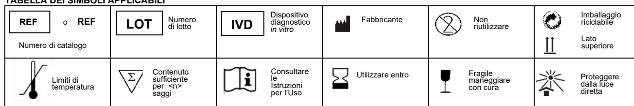
TABELLA DEI SIMBOLI APPLICABILI