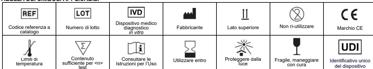
TABELLA DEI SIMBOLI APPLICABILI