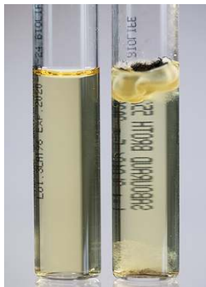
Sabouraud Broth - da sinistra: provetta non inoculata, Aspergillus brasiliensis