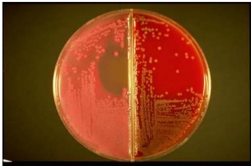
Biosector 3 alla luce normale: colonie di E. coli